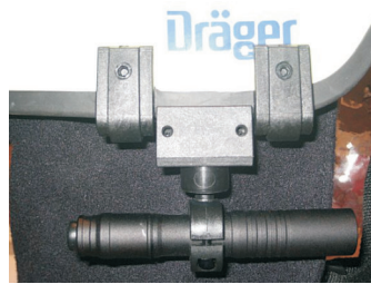
Montageposition am Helm